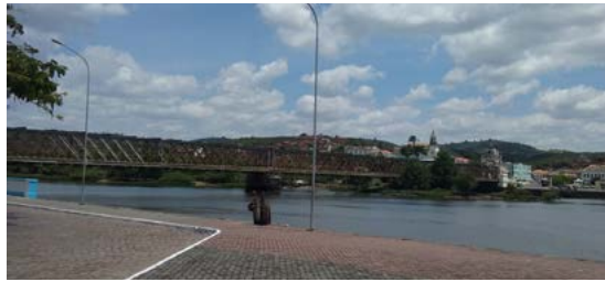
Vista del río Paraguaçu y Cachoeira, Estado de Bahía, Brasil.

Valió la pena conocer y explorar esta encantadora ciudad conocida como la Perla del Recôncavo 3 . Sin embargo, como contábamos con poco tiempo, debimos continuar hacia Cachoeira. Llegamos tarde,