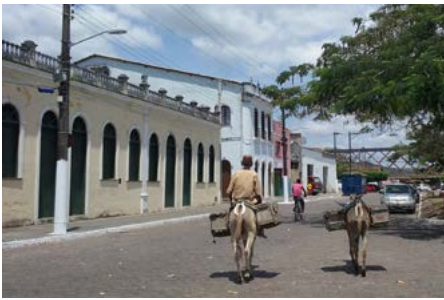
São Felix.