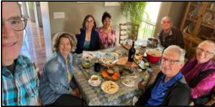
Photo : Autour d'un délicieux « potluck » (repas-partagé), nous avons échangé des histoires de nos voyages et des visites de voyageurs, exprimant notre profonde gratitude d'avoir trouvé Servas.

Nous espérons que Servas continue de nous apporter de la joie, de l'enrichissement et du sens grâce à de nouvelles rencontres et de nouvelles aventures.