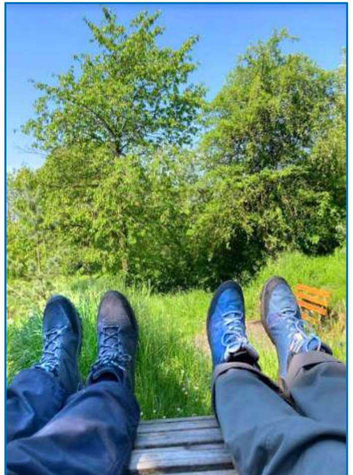
Photo : Nos chaussures de Randonnée.

Nous rentrons au Portugal le coeur comblé de l'amitié de ces 3 nouveaux amis. Nous avons hâte de vivre à nouveau d'autres expériences Servas.