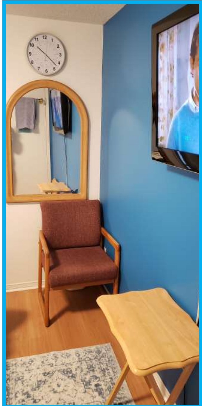
Photo : Les amis apprécient un endroit pour poser leur valise/sac à dos, une chaise, un miroir, un réveil qui ne fait pas tic-tac.

Préparez une valise avec des vêtements, une serviette, une brosse à dents, etc. et rendez-vous dans votre propre chambre d'hôte ou sur votre canapé. Y a-t-il de l'intimité ? Un endroit pour poser vos bagages ?