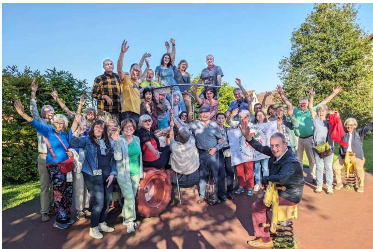
Photo : Rencontre de « nouveaux » amis et « anciens » amis de 25 ans.

Maintenant, chaque année, entre 20 et 30 invités viennent dans l'une des villes partenaires. Les hôtes locaux préparent un programme culturel agréable et tout le monde passe un bon moment. Après quelques années et quelques tournées dans les villes partenaires, nous cherchions une nouvelle ville Servas et nous avons demandé à nos amis belges de Louvain, qui ont volontiers rejoint la rencontre des villes Servas. Des amis de Mayence se sont également joints à nous.